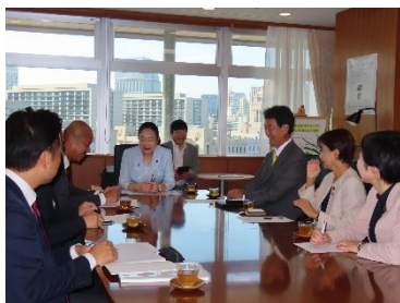
土屋復興大臣への要請