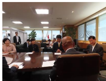
伊藤環境大臣への要請