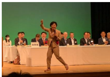
大会挨拶で壇上を駆けめぐる

来年の大会でも、皆さんに良い報告ができるよう、引き続き、活動を行ってまいります！