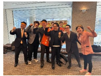
郡山りょう候補予定者を囲んで