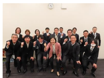
三菱マテリアル岐阜製作所労組②