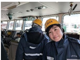
液化CO 2 輸送船の内部

2月10日(月)に、基幹労連国政フォーラムの山岡達丸衆議院議員(北海道9区)の総合プロデュースのもとで、経済産業部門会議メンバーを中心にRapidus(ラピダス)の半導体工場、CCS実証試験センター、CO 2 輸送船舶、AI向けデータセンター予定地など盛りだくさんの視察をしてきました。今後のGX、DX政策や、経済委員会等での質疑に活かしてみたいです。