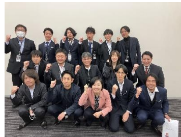
三菱マテリアル岐阜製作所労組①