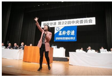
基幹労連中央委員会で挨拶

2月も、組合の旗開きや春闘関連の研修会、集会などが目白押しで、WEBも含めたくさん対応させていただいています。基幹労連の関係では、2月5日(水)の中央委員会、28日(金)のAPおよび政策実現決起集会、また27日(木)には連合の中央集会行進に参加した皆さんに、参議院の議員面会所前でエールを送りました。