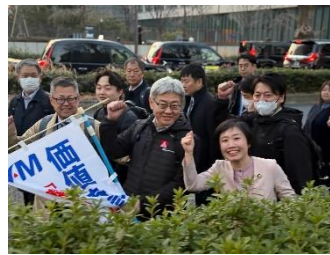
連合の行進に飛び入り参加 (基幹労連、JAMの皆さんと)