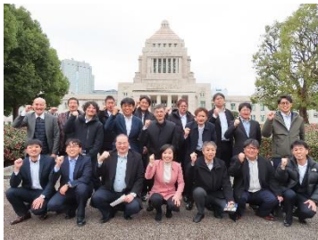
高周波グループ労協