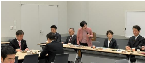
フォーラム幹事長として司会を務めています