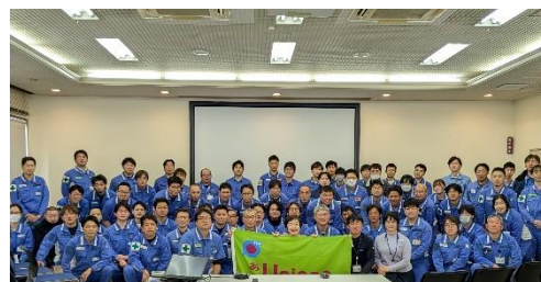
IHI 労連 武蔵支部の皆さんと