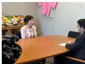
鹿児島 MBC 放送インタビュー