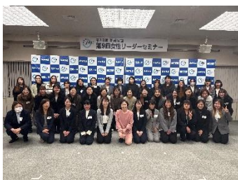
基幹労連 女性リーダーセミナー