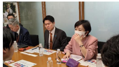
郡山議員と経済産業省からヒヤリングを受ける

【レアアース】スカンジウム、イットリウム、そしてランタノイドなど、計17種類の元素の総称。地球上に賦存している量は少なくないものの、取り出すのが大変なことから「レア(希少)」と呼ばれている。磁石・蛍光・触媒などの特殊な物性を持つため、ハイテク製品に不可欠な戦略資源で、中国が鉱石の約7割を生産している。