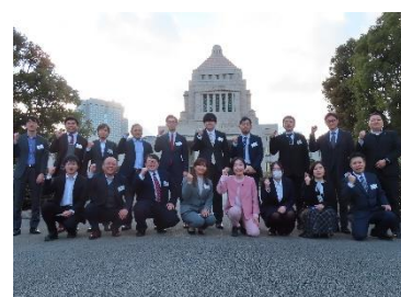
基幹労連 フェロアロイ部会