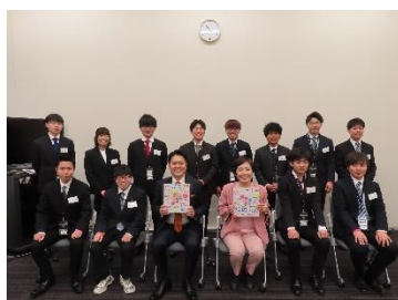
神戸製鋼所労組高砂支部

AP26春季取り組み・春闘が本格的に始まりました。物価高を上回る賃上げ、労働条件の改善に向けて、ともに頑張りましょう。私も国会から応援しています。ご安全に。